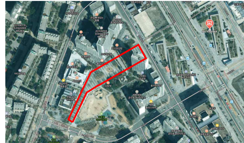
한글사랑거리 앞 모습